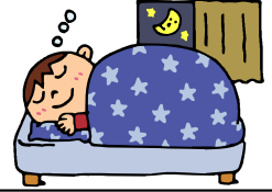
まなびフェストのふりかえり(4・5月)