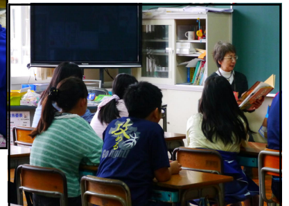
【6年：〇〇さんの読み聞かせ】