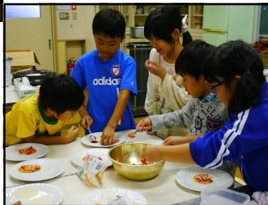
【3年：笑顔でピザ作り】