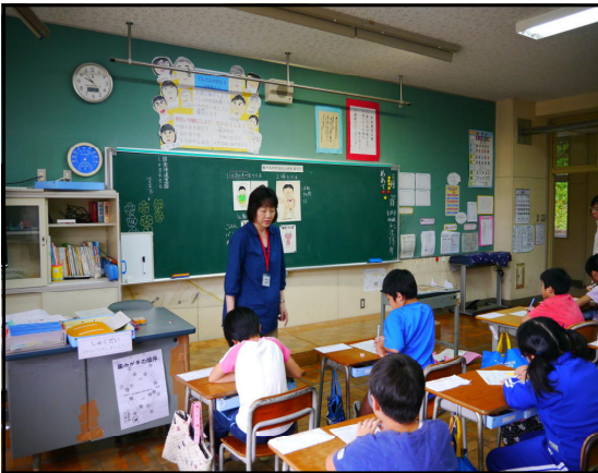
【3年：学校給食センターの栄養教諭 〇〇先生による食育授業】

学年によっては1学期に、「忘れ物」がなかなか減らないという声も聞かれました。改善させたいですのでご家庭でも時々声がけをお願いします。