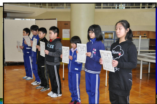
新旧執行部のみなさん