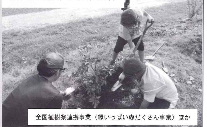
全国植樹祭連携事業（緑いっぱい森たくさん事業）ほか