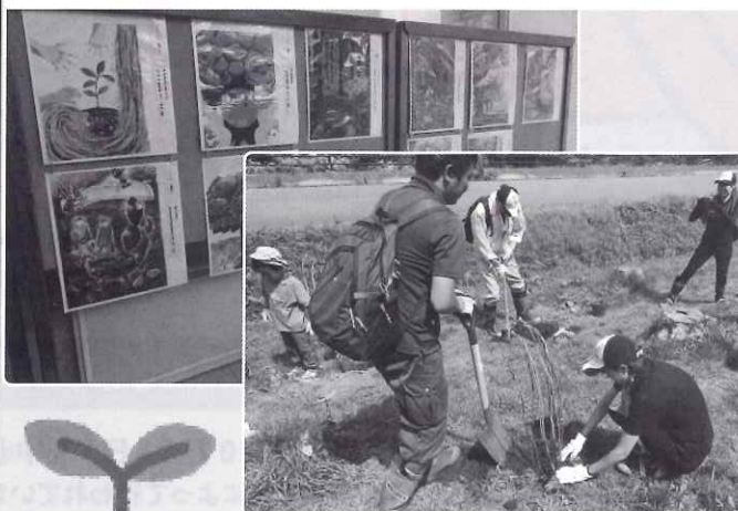
(上) 国土緑化運動・育樹運動ポスター作品展示 (下) ボランティア植樹会