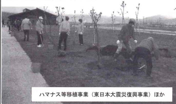
ハマナス等移植事業（東日本大震災復興事業）ほか