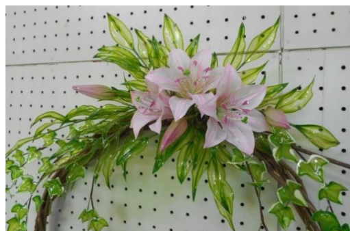
「すかしユリ」に挑戦!!