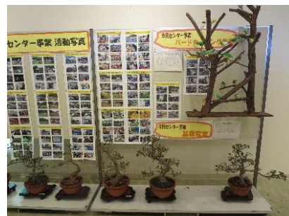
〈 前年の様子 〉