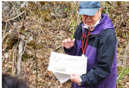
八屋さん今回もありがとうございます。