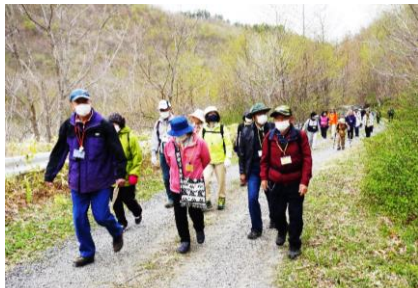
皆さん歩き慣れてます!