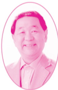
大塚富夫アナウンサー