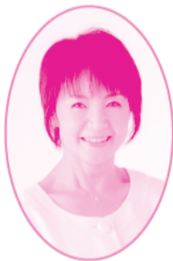
水越かおるアナウンサー