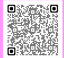
＜救急ガイドブック＞