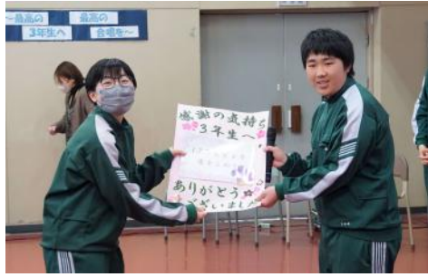
1・2年生から3年生へ

二月二日(金)に多目的ホールで予餞会を行いました。校長先生の挨拶に続き、一・二年生が三年生へ感謝の呼びかけを行い、感謝のメールと合唱「遙か」を送りました。また、卒業までの手作り日めくりカレンダー(一人ひとりのメッセージ入り)の贈り物を手渡しました。三年生からは、お礼の言葉と、「正解」