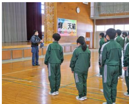
入室前に説明を受けます