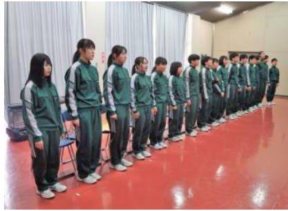
3年生からメッセージ・合唱