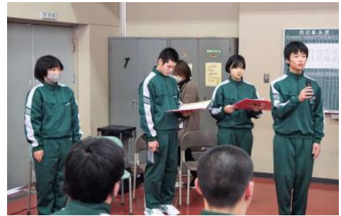
企画や運営を行った生徒会執行部