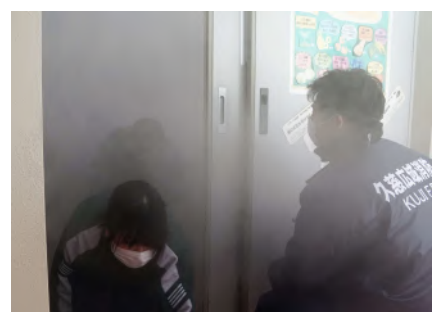
室内は煙が充満して真っ暗