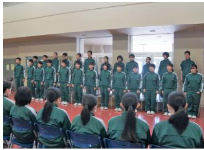
1・2年からメッセージと合唱

は激励のメッセージの贈り物がありました。スローガンを、「沁歌(しんか)〜最高の三年生へ 最高の合唱を〜」として生徒会執行部を中心に練習に取り