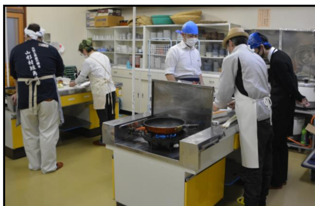
「短角牛丼」・「テールスープ」の様子