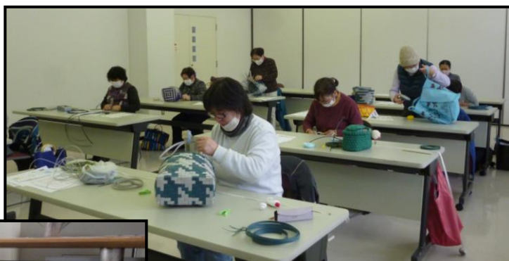
終盤の作業の様子