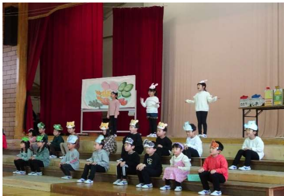
【1年】劇: サラダでげんき お母さんを元気にするには? サラダが完成!