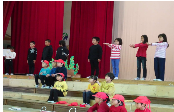
【2年】劇: 名前を見てちょうだい 世界で一つだけの名前をいつまでも大切に!