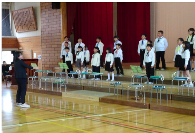
【4年】合奏・合唱: 「イロトリドリ」の世界へようこそ 友達のよさを発表、手話も披露