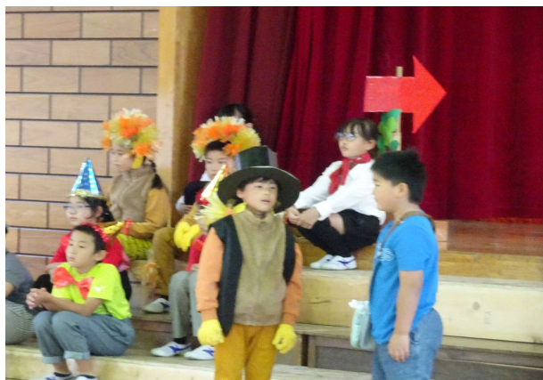
【3年】劇: サーカスのライオン 少年を助けたライオン 協力! 3シャイン輝く!