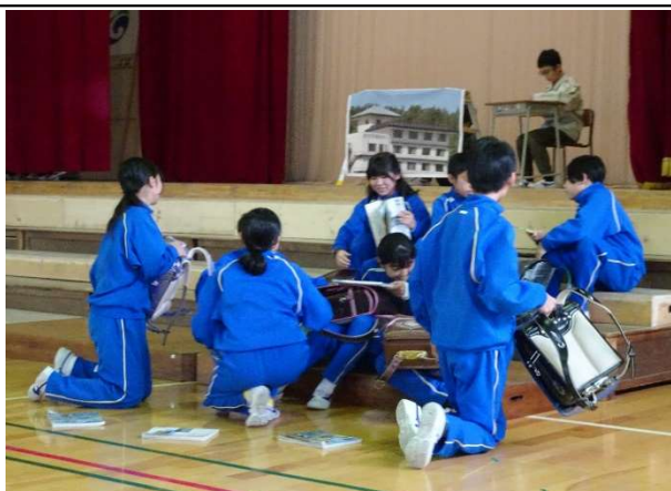
【6年】劇: 「命を守る ふるさとを守る」 田老で教わったこと、考えたこと