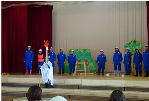
【5年】劇: 大飛躍のグリーンキャンプ! 14人の協力した姿! 学校生活でも感謝の気持ちを!