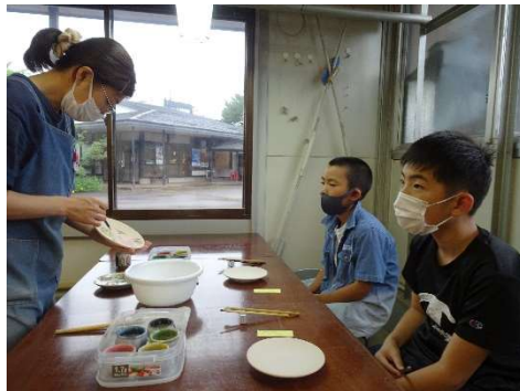
【盛岡手づくり村(絵付け体験)】