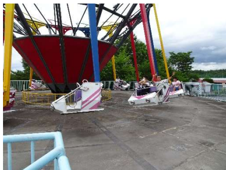
岩山パークランド