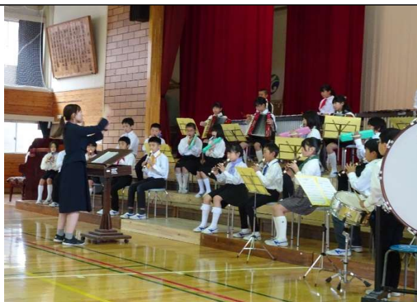
【リード合奏団】劇: ピースサイン 息の合った見事な演奏