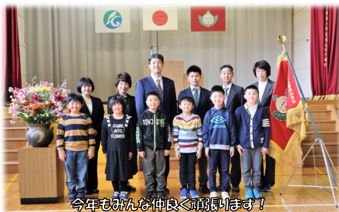
今年もみんな仲良く頑張ります！

校庭の雪がもすっきり解け、あたたかな春の訪れを感じます。いよいよ令和4年度がスタートしました。