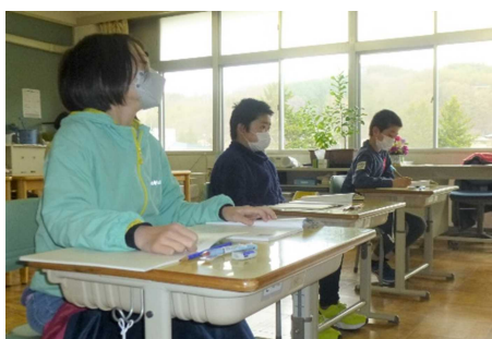
5年生：算数 整数と小数の仕組みを見なおそう