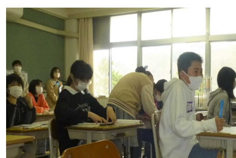
6年生：算数 つり合いの取れた図形を調べよう

授業参観に引き続き、学級懇談会、PTA総会が行われました。これまでコロナ禍によりPTA総会は開催を見合わせておりましたが、4年ぶりに保護者の皆様に参会していただき、今年度の授業計画について承認いただきました。今年度のPTA役員は次の方々になります。1年間どうぞよろしくお願いいたします。