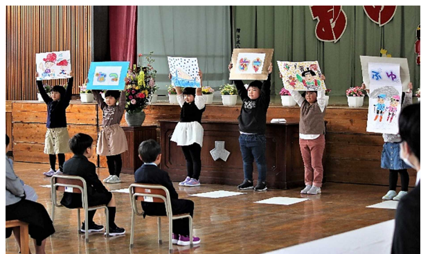
(写真上段は記念写真、下段は2年生による歓迎の言葉)