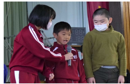
「よろしくお願いします！」