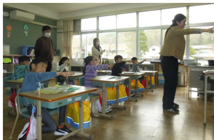
1年生：国語 ひらがなをかいたりよんだりしよう

保護者の方々におかれましては、年度初めのお忙しい中、来校いただき、ありがとうございました。