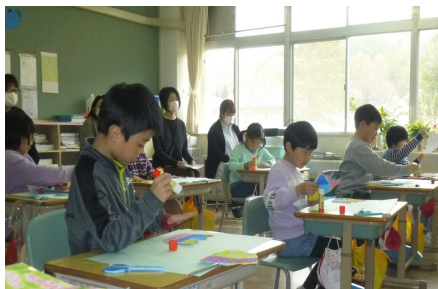
2年生：図工 びっくりたまご