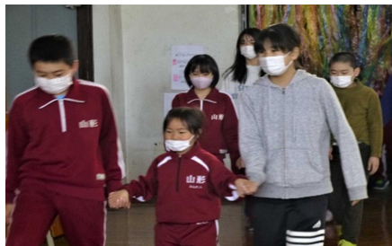
6年生のエスコートで入場

当日は1年生の紹介や全校ゲーム、1年生のお礼の発表などがあり、温かな雰囲気にもまれた楽しい時間になりました。