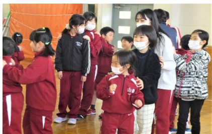
ゲームは「じゃんけん列車」