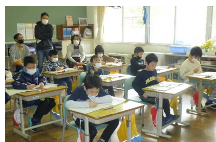
3年生：算数 九九を見なおそう