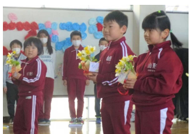
2年生からのプレゼント