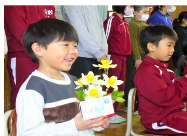
とってもうれしそう！