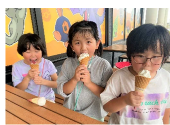
1・2年生 「もぐらぴあ・道の駅 いわて北三陸」