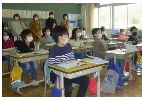
4年生：算数 1億より大きい数を調べよう