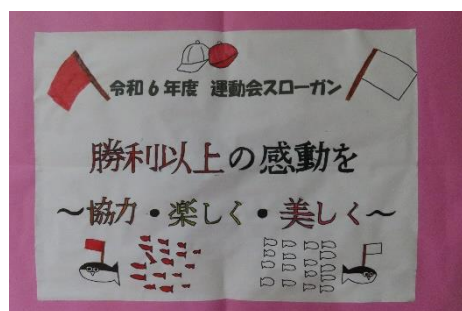
↑ 運動会スローガン