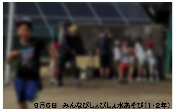
9月5日 みんなびしょびしょ水あそび(1・2年)