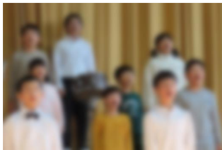
【全校合唱・合奏『平山讃歌・Believe』】