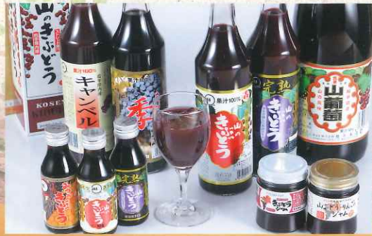
栄養豊富な山ぶどう製品