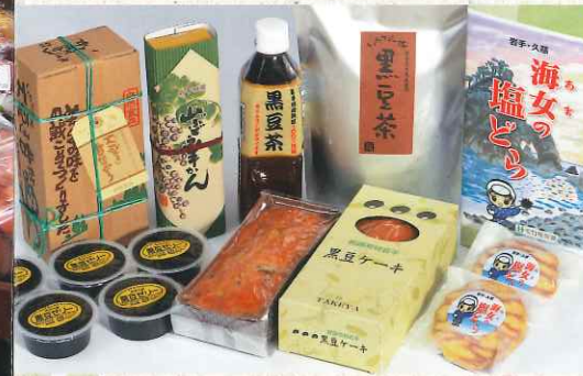
岩手県産 100%の黒豆製品