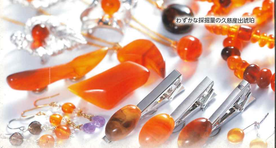
わずかな採掘量の久慈産出琥珀