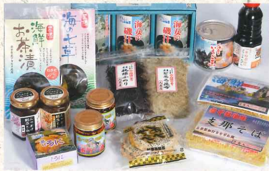
久慈のこだわり加工品