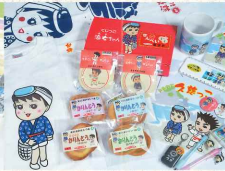
ご当地キャラクターグッズ