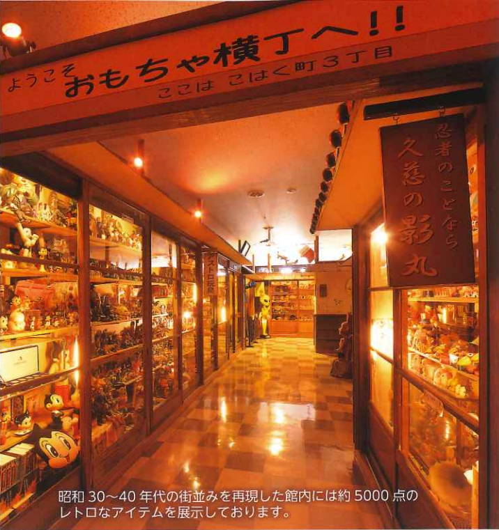
昭和 30~40 年代の街並みを再現した館内には約 5000 点のレトロなアイテムを展示しております。