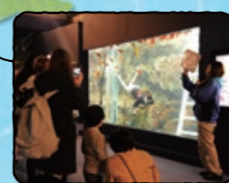
久慈地下水族科学館 もぐらんぴあ

白い灯台 ・若いころの春子が不満を書きなぐった場所 ・アキが自転車で飛び込んだ場所 ・最終回でアキとユイが立つ場所