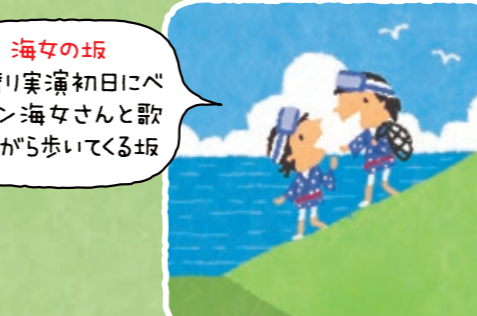
海女の坂 素潜り実演初日にベテラン海女さんと歌いながら歩いてくる坂

あまちゃん街道 「あまちゃん」のロケ地や三陸復興国立公園を代表する景観が続きます。