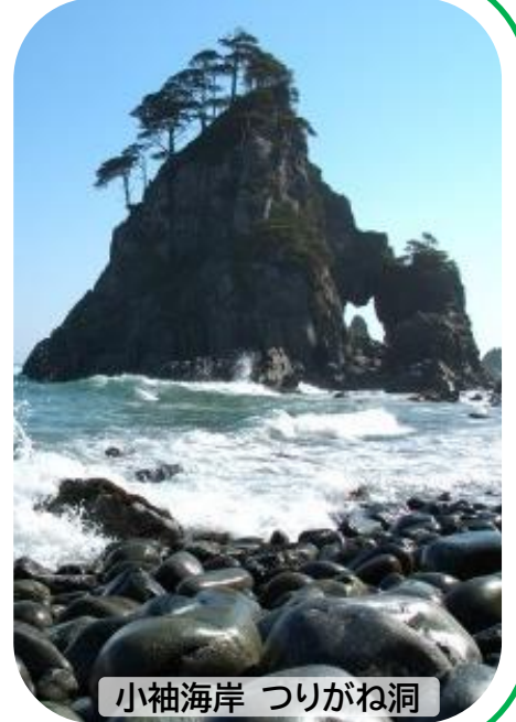
小袖海岸 つりがね洞

当市では、久慈市をPRして下さる 「北三陸久慈市ふるさと大使」を随時募集しております!!