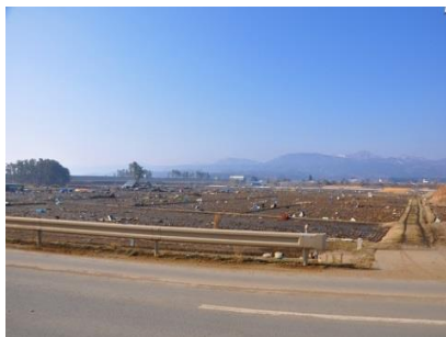
(野田村 浸水被災後)