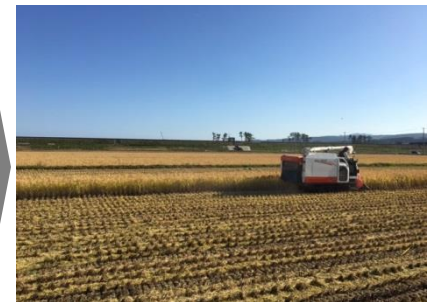
(区画整理工事完了)