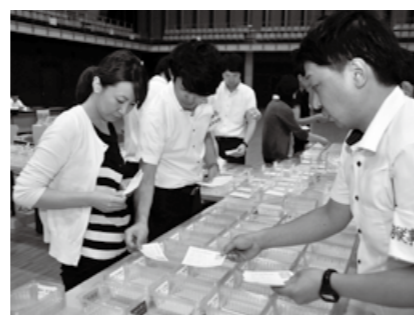
市民体育館で行われた開票作業

久慈市議会議員選挙の投開票が7月26日に行われ、市民の代表である新しい市議会議員24人が決定しました。 元職2人・新人5人含む24人 議員定数は、これまでと同じ24人。現職18人のほか元職2人、新人8人の計28人が立候補し、7月19日の告示日から7日間、熱い選挙戦を繰り広げました。 開票は投票日当日の午後8時30分から市民体育館で行われ、元職2人、新人5人を含む24人の当選が決まりました。 当日の有権者数は3万95人で、投票者数と投票率は2万983票(69・72%)。平成23年に行われた市議会議員選挙と比べて0・74%減少しました。投開票の結果は左表のとおりです。 議員の任期は平成31年8月6日までの4年間。市民の代表として、市の施策や予算などを審議し、市民生活の向上と施政発展に取り組みます。