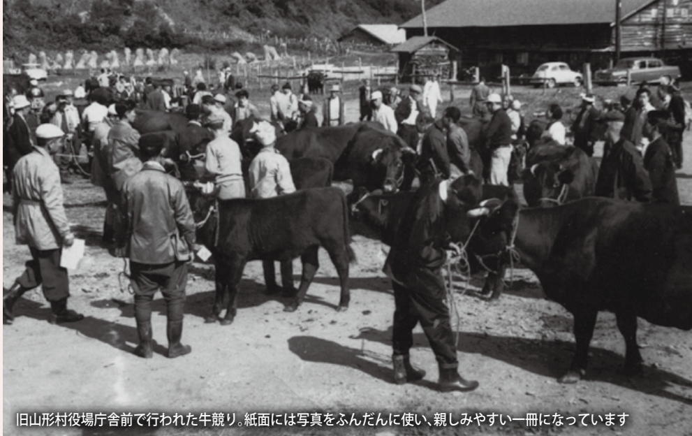
旧山形村役場庁舎前で行われた牛競り。紙面には写真をふんだんに使い、親しみやすい一冊になっています