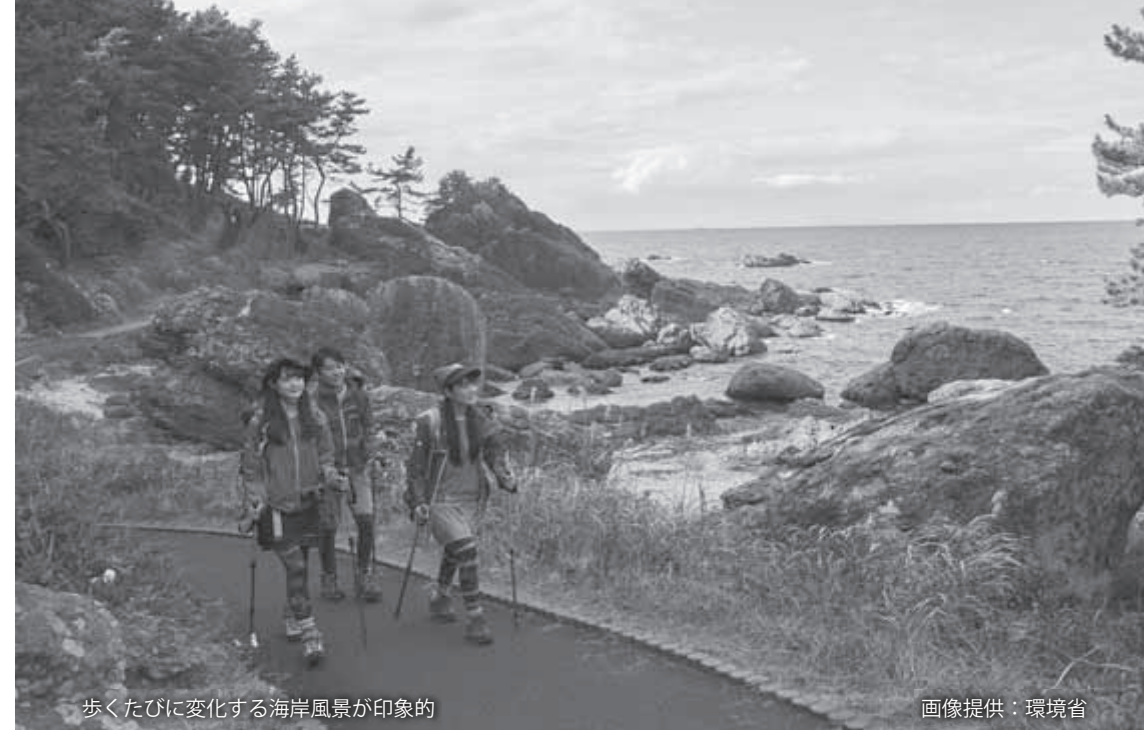
歩くたびに变化する海岸風景が印象的