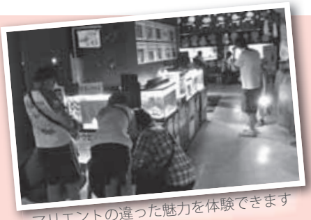
マリエントの違った魅力を体験できます