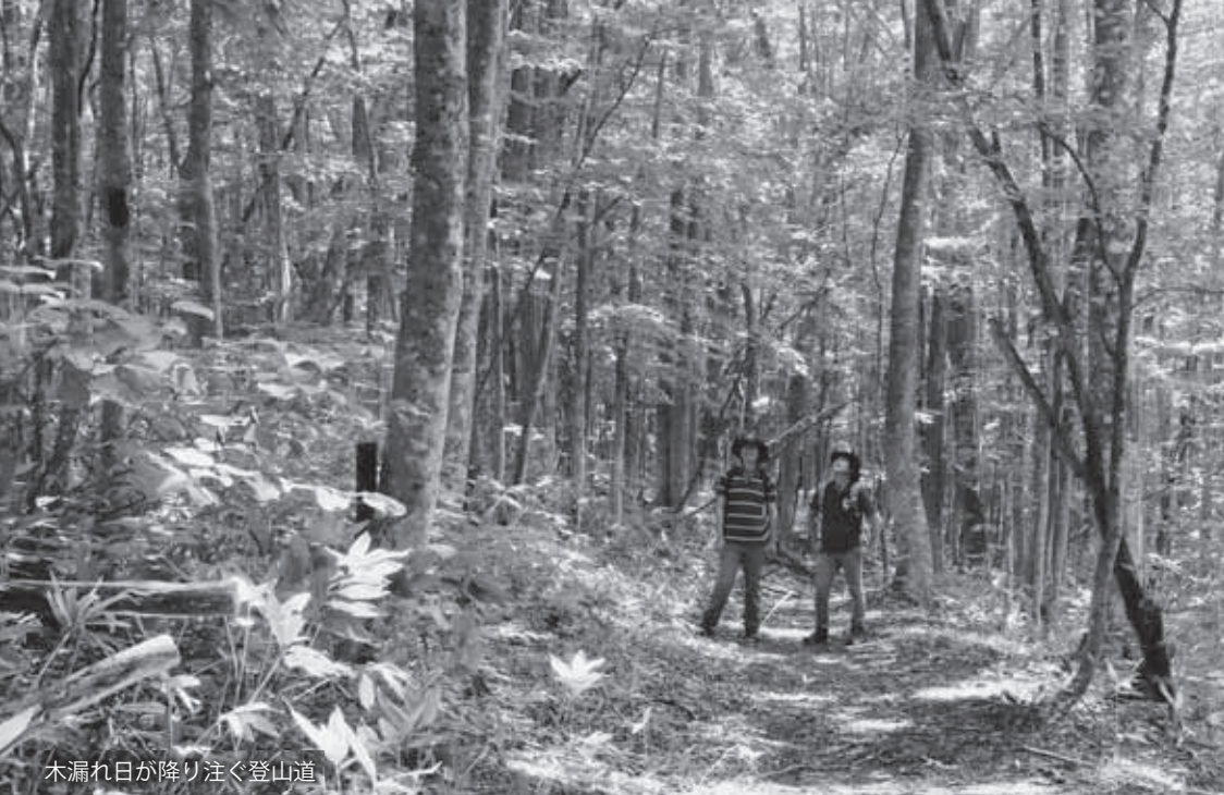
木漏れ日が降り注ぐ登山道