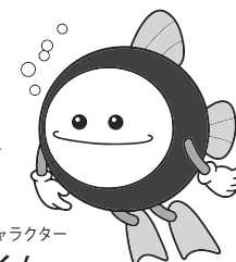
下水道マスコットキャラクター スイスイくん