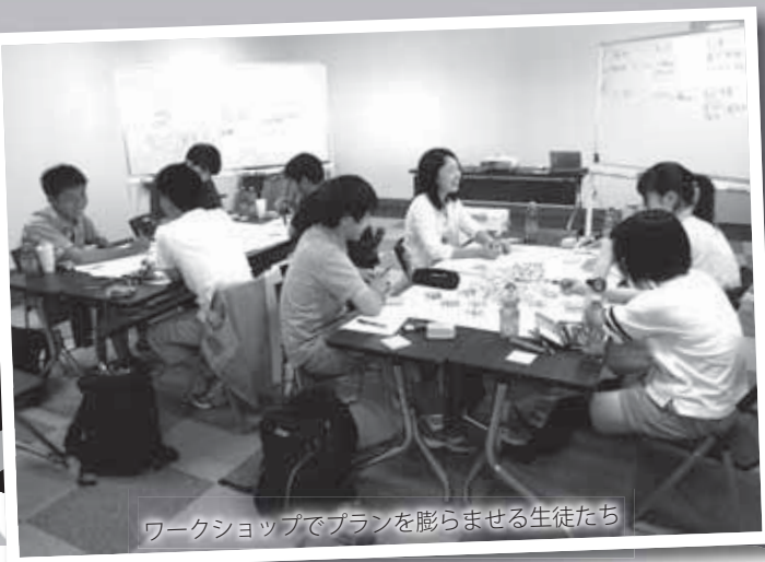
ワークショップでプランを膨らませる生徒たち