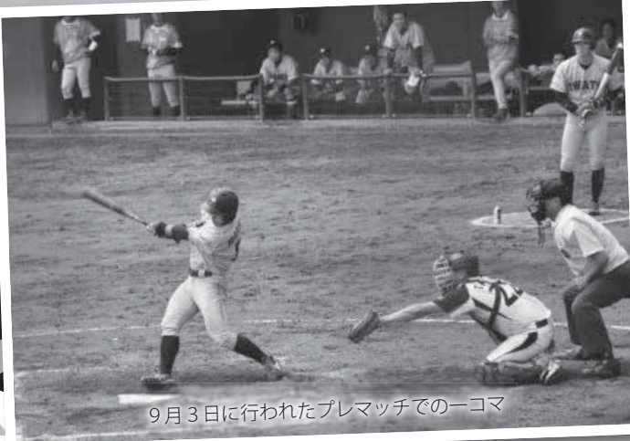
9月3日に行われたプレマッチでの一コマ