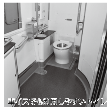
車イスでも利用しやすいトイレ

運転開始に先駆け、11月9日に実施された試乗会には、鉄道関係者や各地区の利用者などが参加。参加者からは「走っている時の音が小さくなった」「トイレが広くてびっくりした」「都会の電車のような外観、車内もスペースが広くて乗りやすいです」など好評の様子でした。