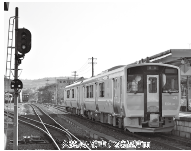
久慈駅に停車する新型車両

12月2日からJR八戸線（八戸駅・久慈駅）で新型車両が運転を開始します。車両の形式はキハE130系500代で、海をイメージさせる青色を取り入れたデザイン。18両が順次導入される予定です。新型車両は、冷暖房完備で、行き先駅などの案内表示や、大型トイレを設置。ドアは片側3力所、押ボタン式の両開きドアとなり、スムーズな乗降が可能となっています。1両編成の場合、定員は96人から115人に増加、座席数は66席から34席となり、立乗りスペースが拡大します。