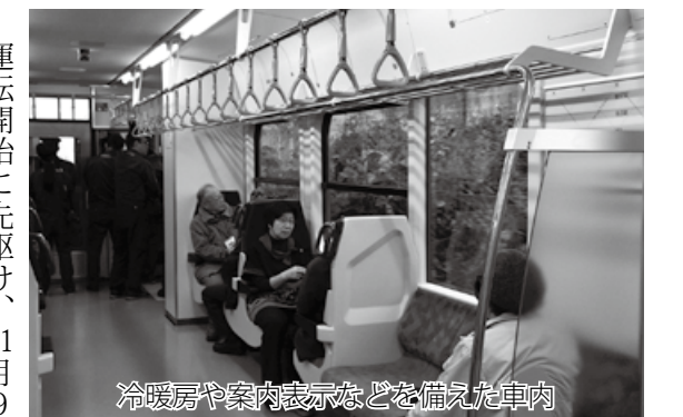
冷暖房や案内表示などを備えた車内

運転開始に先駆け、11月9日に実施された試乗会には、鉄道関係者や各地区の利用者などが参加。参加者からは「走っている時の音が小さくなった」「トイレが広くてびっくりした」「都会の電車のような外観、車内もスペースが広くて乗りやすいです」など好評の様子でした。