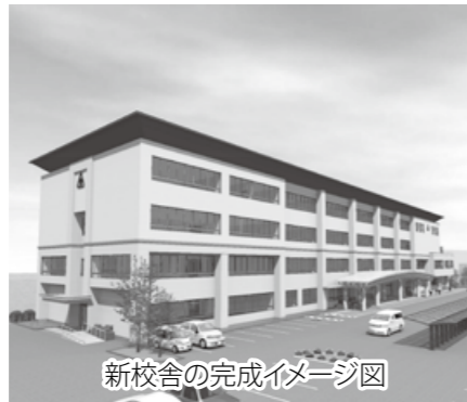
新校舎の完成イメージ図

10月から岩手県立久慈高等学校の改築工事が始まりました。新しい校舎は、平成30年度末までに現在のグラウンドの東側に整備し、平成31年度からの利用を予定しています。引き続き平成32年度まで既存校舎の解体とグラウンド整備工事を行う予定です。工事期間中は久慈高校周辺で大型の工事車両の通過が増加します。