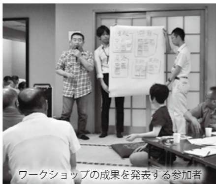
ワークショップの成果を発表する参加者

市民の皆さんの意見を市政に反映させるため、7月11日から8月22日までの期間中の10日間、市では市内10会場市政懇談会を開催しました。各地域から161人の参加をいただき、市の公共施設等総合管理計画の説明の他、水害時の避難行動をテーマにワークショップを開催。普段の備えや避難時の注意点など意見交換を行い、次なる災害への備えを新たにしました。