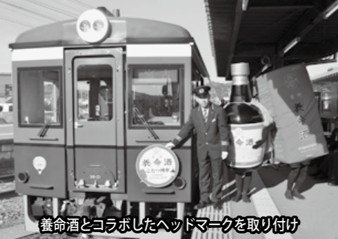
後命酒とコラボしたヘッドマークを取り付け