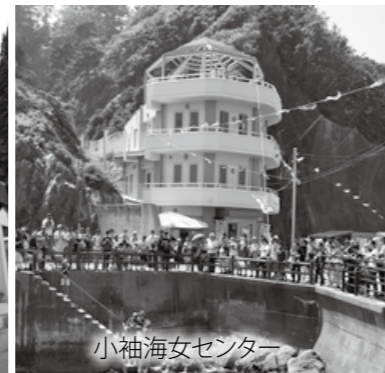
小袖海女センター

市では、下表のとおり施設の管理・運営を市に代わって行う指定管理者を指定しました。詳しくは担当課にお問い合わせ下さい。