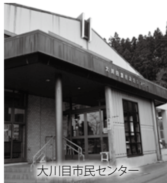
大川目市民センター