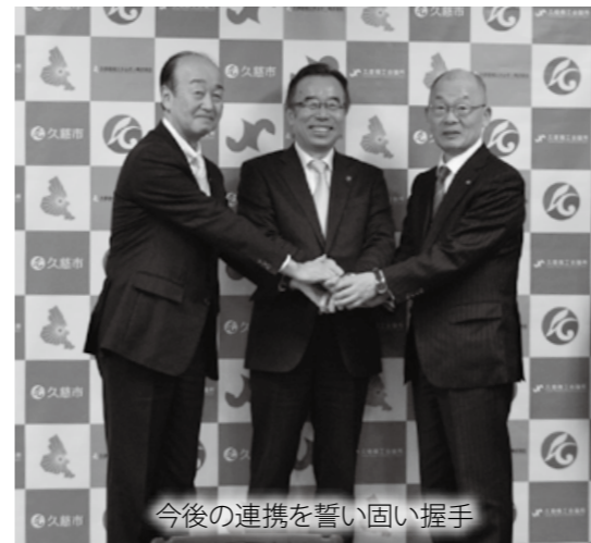
今後の連携を誓い固い握手

1月18日、市と久慈商工会議所、久慈地域エネルギー(株)の三者が「エネルギーの地産地消による地域活性化に関する協定」を締結。協定は、エネルギーの地産地消による再生可能エネルギーの推進と豊かで自立した持続可能な地域社会を達成することを目的としたものです。 久慈地域エネルギー(株)は久慈地域に本社を置く4社で設立。年度内には市も出資することが決まっており、自治体が出資する小売電気事業者、いわゆる自治体新電力が岩手県内で初めて誕生します。 当日は、市役所で三者がそれぞれ協定書に調印。遠藤謙