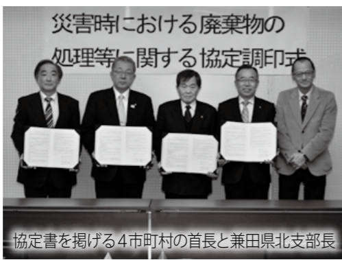
協定書を掲げる4市町村の首長と兼田県北支部長

広域の8市町村は、県産業廃棄物協会東北支部と「災害時における廃棄物の処理等に関する協定」を締結しました。この協定は、災害時に一般廃棄物処理業者のみでは対応が難しい場合に、協会の会員がその処理を補完するもので、速やかな撤去・運搬・処分を