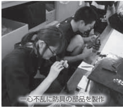
一心不乱に防具の部品を製作

9月5日から7日にかけて、市外の若者を対象とした就業体験ツアー「久慈市で暮らす・働く体験」を実施。このツアーには香川県や京都府などから9人の若者が参加。参加者は久慈琥珀(株)、日本武道具製造(株)、畑田保育園に分かれ、琥珀商品や剣道防具の製作、保育園の運動会の準備などを体験しました。