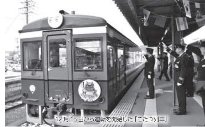
12月15日から運転を開始した「こたつ列車」