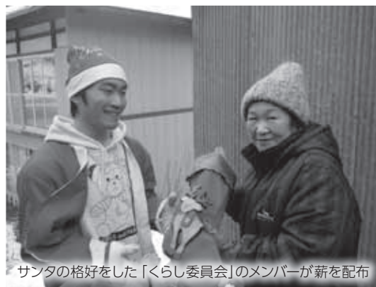
サンタの格好をした「くらし委員会」のメンバーが雪を配布