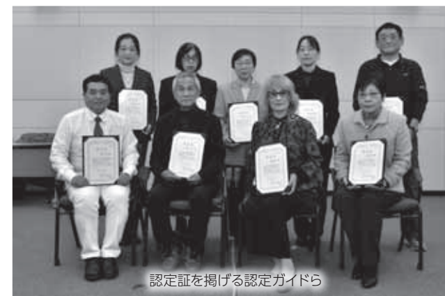
認定証を掲げる認定ガイドら

平成29年3月に観光関係15団体で設立された「久慈市ガイドの会」。当市の自然や歴史、文化などの観光資源を来訪客に紹介し、交流人口の拡大を目指して活動しています。