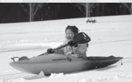
誰でも簡単にスノーカヤックが体験できます

岡二戸市観光協会浄法寺支部(浄法寺総合支所地域課内) ☎0195-38-4473