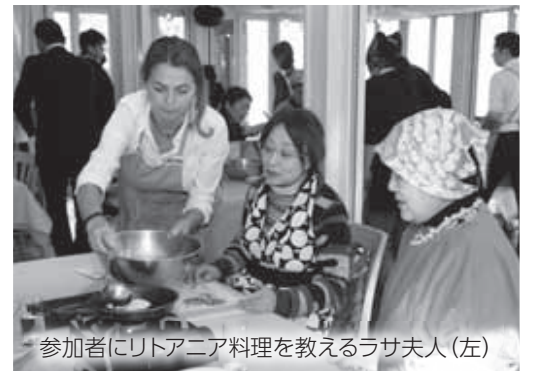
参加者にリトアニア料理を教えるラサ夫人(左)

リトアニアのゲディミナス・バルブオリス駐日特命全権大使とラサ夫人が、1月30日から31日にかけて久慈市を訪問しました。 バルブオリス大使らは、市役所での歓迎セレモニーの後、もぐららびあや三船十段記念館を視察。市内催事場で行われたレセプションには115人が参加。日本舞踊などを披露し、盛大に大使らを歓迎しました。レセプションでは、遠藤市長が大使らに琥珀の懐中時計やネックレスなどを贈呈。大使からは琥珀のペーパーナイフやリトアニアの書籍が当市に贈られました。レセプションに先立ち開催された講演会では、大使が「100年に渡る日本とリトアニアの友好関係」と題し講演。大使は「リトアニアにとって日本・久慈はベストフレンド。この琥珀を通じた絆を大事にしていきたいです」と今後のさらなる友好を誓いました。 翌31日には、市内レストランでリトアニア料理教室が行われ、15人の市民らが参加。ラサ夫人が魚のスープやジャガイモのパンケーキなど代表的なリトアニア料理を参加者に紹介しました。できあがった料理を食べた参加者は「パンケーキはモチモチ!」「スープもスパイスがきいていてとても美味しい!」と大満足の様子でした。