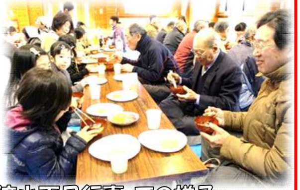
「三世代交流小正月行事」での様子