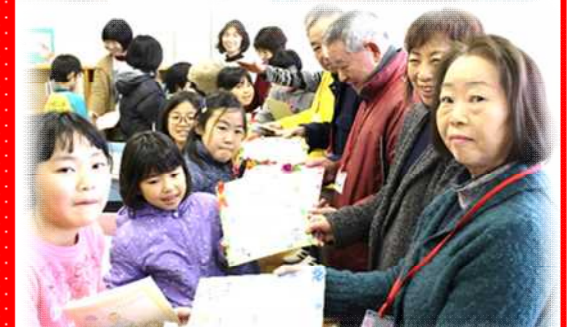
閉講式で、参加児童がサポーターの皆さんへ感謝状を作って贈りました。