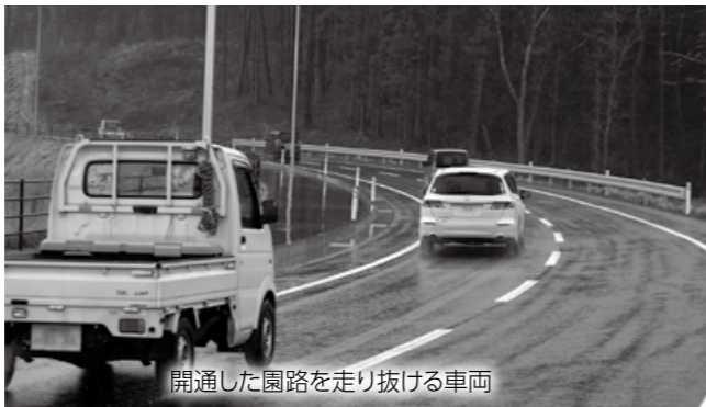
開通した園路を走り抜ける車両

平成25年から整備を進めてきた久慈市総合防災公園。4月26日に暫定開園式が行われ、旭町と夏井町大崎をつなぐ園路(1314m)と多目的広場2.4(1.85ha、0.27ha)の運用が開始されました。