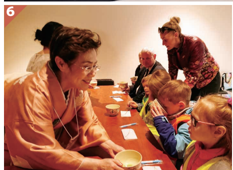
1 / 柔道交流には、クライパダスポーツセンターの柔道部に所属する41人が参加 2 / オリンピックデーでは両市の旗にたくさんの応援メッセージが寄せられました 3 / 投げ技の手本を見せる市柔道協会員 4 / 初めての書道を体験。きれいな漢字を書きあげました 5 / 書道パフォーマンスに目を奪われるクライパダ市民ら 6 / 先生から作法を教わりながら抹茶を飲む子どもたち