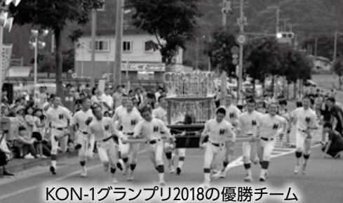
KON-1グランプリ2018の優勝チーム