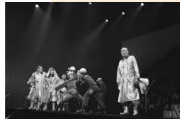
大迫力！だけど、どこかコミカルな演技を展開

観客はステージ上で繰り広げられる人間ドラマに、消防団活動の重要性を確かめるとともに、地域で成り立つ消防団の大切さを感じていました。