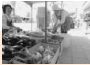
新鮮な野菜や果物が彩りを添えます

3と8のつく日に開催される市日（市日組合主催）が、電線地中化工事に合わせて二十八日町商店街に移転しました。来年の3月まで同所で開催される予定です。移転初日となった8月23日、出店者の中には「こちらの通りは日当たりが良い。昔はここで開いていましたよ」と懐かしむ声、商店街の店主は「市日のおかげで人がいる。いつもより早く店を開けたら、お客さんが来た。相乗効果ですね」と笑顔を広げていました。