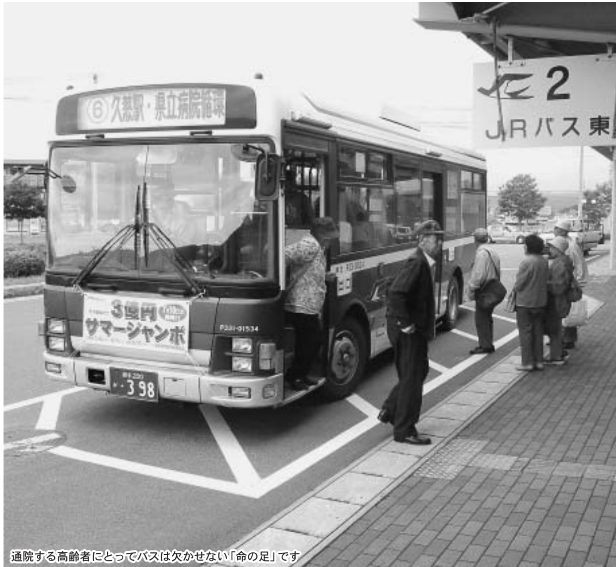
通院する高齢者にとってバスは欠かせない「命の足」です

JRバス東北(株)から今年の2月、管内バス路線の廃止の意向が示されました。これにより、市は地域の足を確保するため、代替運行路線を計画中です。路線は現行のJR路線を基本に、市民バスなどを統合するなどして利便性の向上を図ります。本号では、計画路線数や主な経路についてお知らせします。