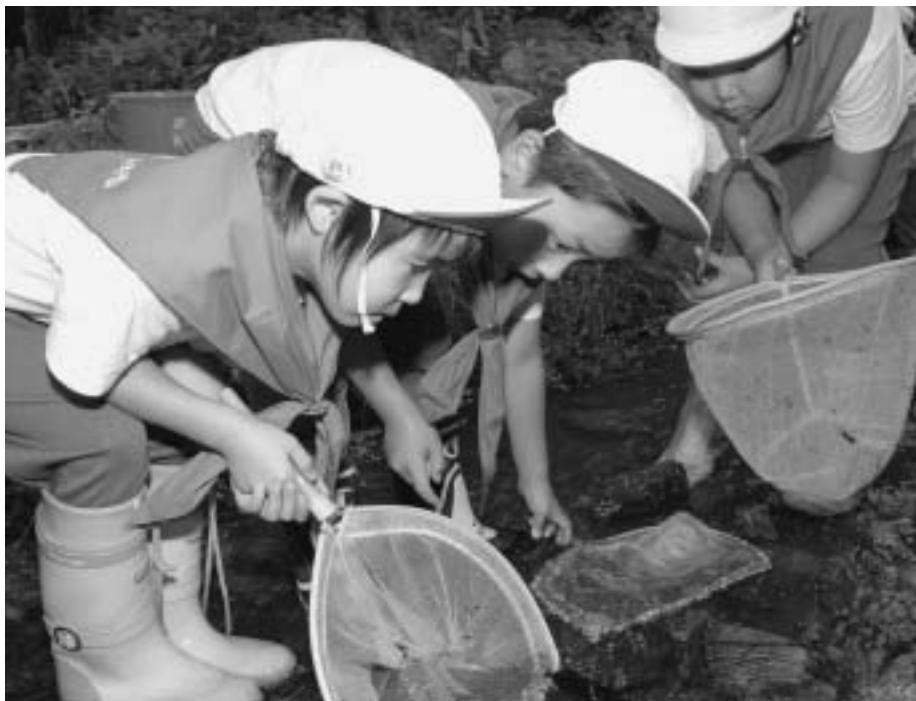
網の入れ方もコツあり。上手にすくえるかな?

日野沢小学校では平成7年度から、日野沢川の支流である小平澤川でハナカジカの生息状況の調査を年2回行っています。今年の1回目の調査は5月12日、2回目は9月11日に行いました。