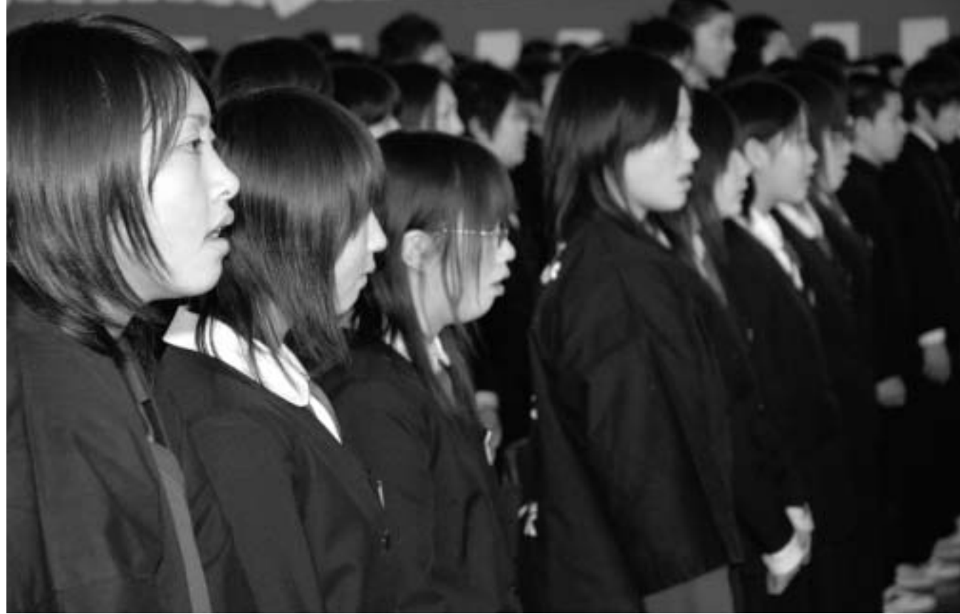
美しい合唱で、新校舎に校歌を響かせる生徒たち

人)の校舎移転記念式典は、始業式となった1月16日、新校舎の体育館で行われました。普通教室や特別教室、テニスコートなどを新たに増設したほか、通学路には防犯灯57基、学校前の道路などを整備しました。