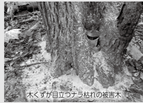
木くずが目立つナラ枯れの被害木