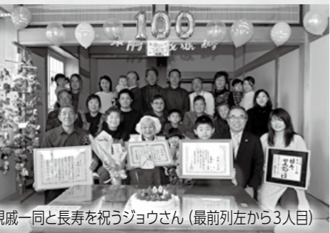
親戚一同と長寿を祝うジョウさん(最前列左から3人目)