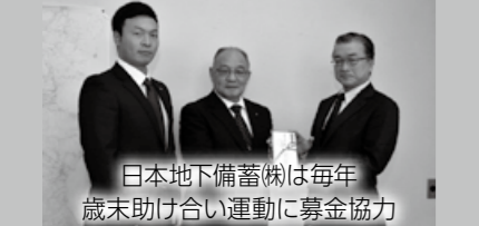
日本地下備蓄(株)は毎年歳末助け合い運動に募金協力