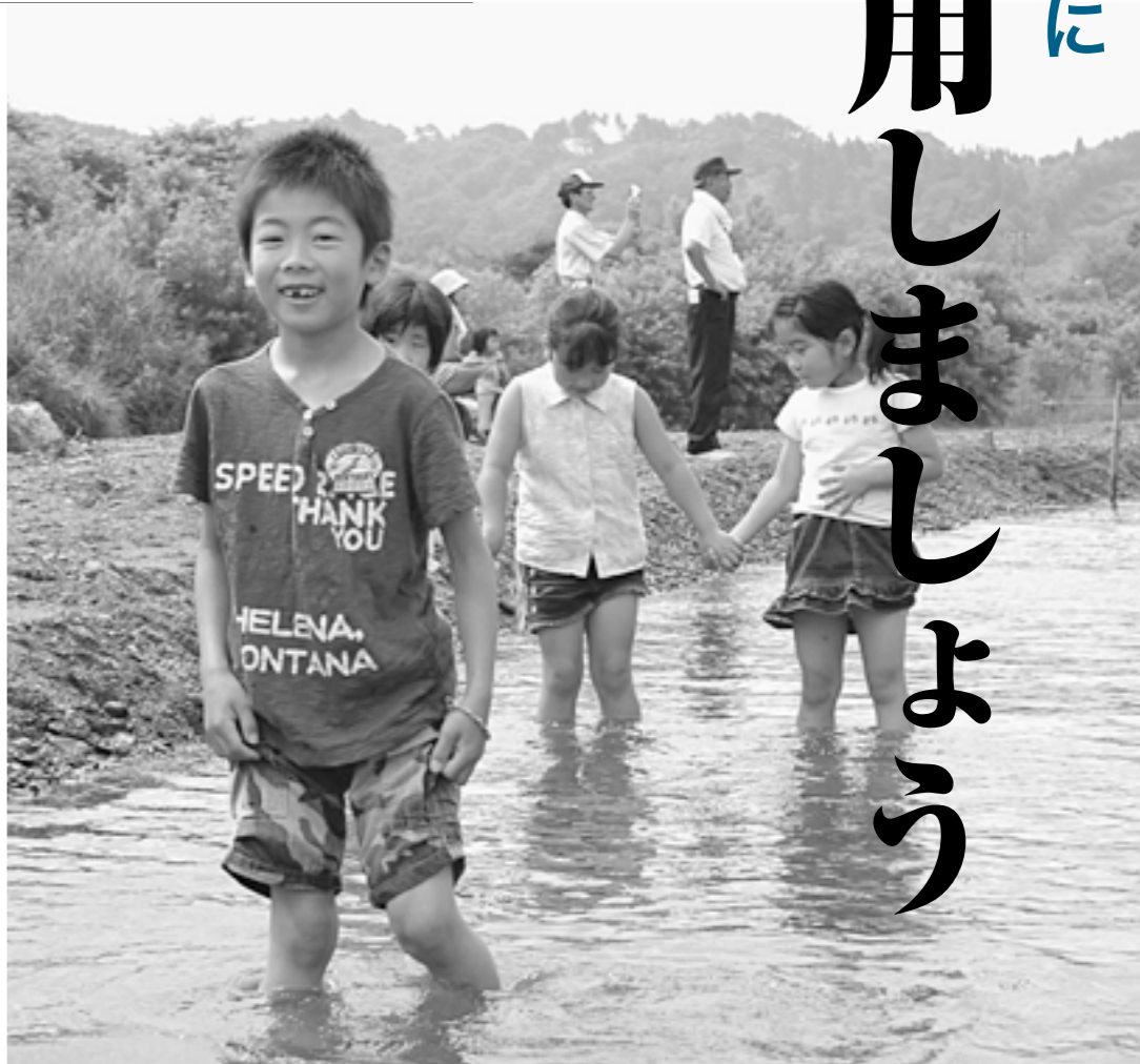
ジャブジャブと川に入って遊ぶ子どもたち。きれいな水には笑顔が集まります。みんなの笑顔のためにも、きれいな水を残したいですね。（写真・8月3日に開催された長内川川まつり）

下水道は、食事や洗濯など普段の生活から出る汚れた水をきれいにして自然に返す施設です。下水道が整備され、各家庭や事業所などが排水設備（台所やトイレなどの汚水を下水道に流すためのもの）を整備すると、汚れた水が下水処理場で浄化され、きれいな状態