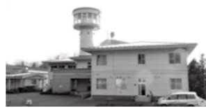
県立久慈病院(上)と総合福祉センター(下)