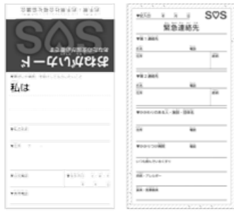
カードは名刺サイズにたたんで携帯できます