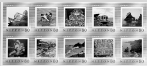
北限の海女など北三陸の魅力満載の切手シート