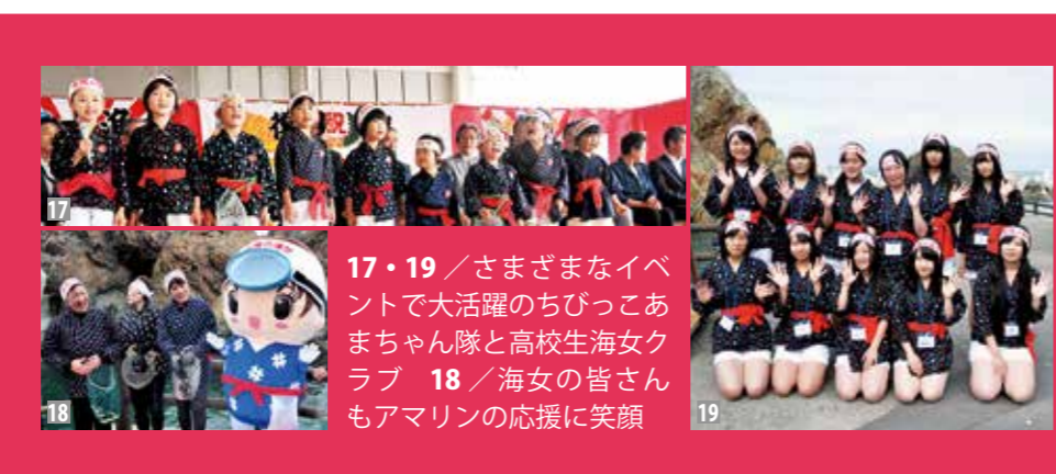
17・19 / さまざまなイベントで大活躍のちびっこあまちゃん隊と高校生海女クラブ 18 / 海女の皆さんもアマリンの応援に笑顔