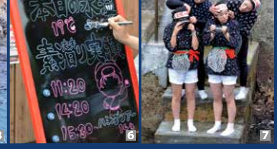
1・2 / 潜って採ったウニを観光客に披露する海女 3 / 列になって素潜り漁に向かう海女 4・5 / 実演を終えて大勢の観光客に拍手で迎えられる高校生海女クラブ 6 / 水温と実演時間を知らせる手書きの看板 7 / 素潜りの準備をする海女