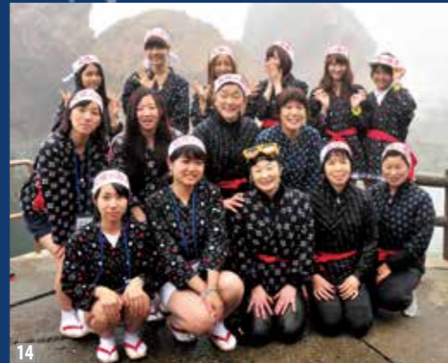
13・14 / 小袖海女センターを訪れたAKB48メンバー 15 / 採ったウニを子どもに披露 16 / 素潜りを見学する観客の皆さん

7月28日、復興支援のためAKB48のメンバー5人が海女の衣装で小袖海女センターを訪問。海女の素潜り実演を見学後、サイン入り顔出しパネルの贈呈が行われました。