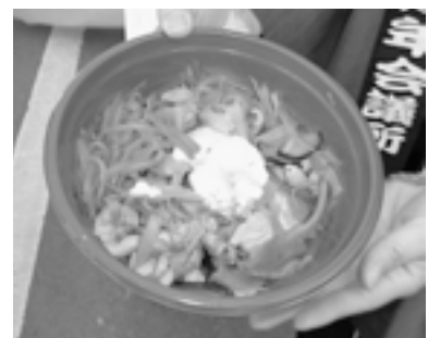
開始早々に完売し、追加発注した「とり南蛮丼」

るさとグルメグランプリ」が開催され、サバカレーやすき昆布入り焼きそばタコスなど地元の食材を使った7品がエントリしたほか、久慈まめぶ汁や八戸せんべい汁などもゲストで参加しました。