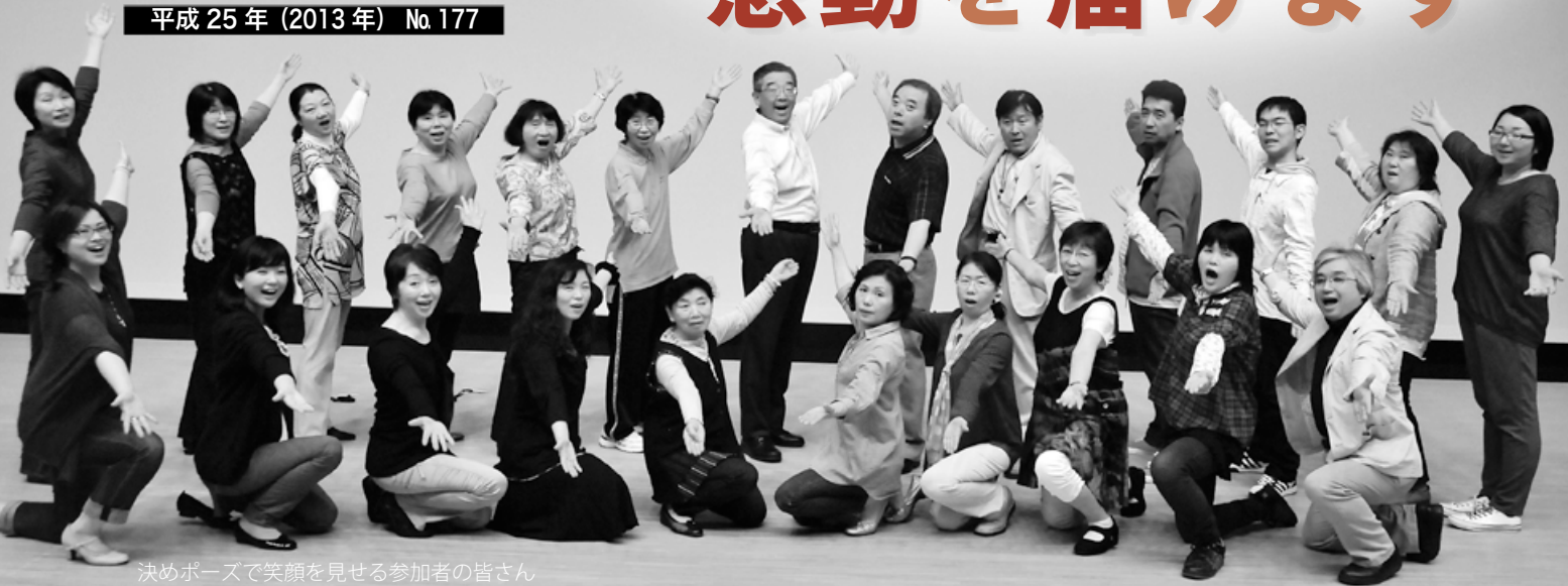
決めポーズで笑顔を見せる参加者の皆さん