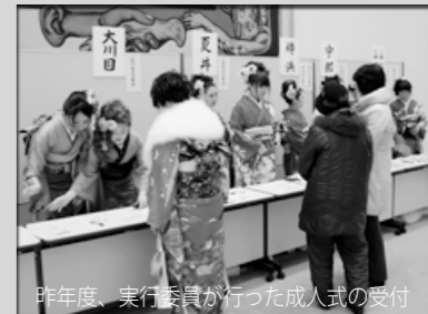
昨年度、実行委員が行った成人式の受付

平成26年1月12日(日)に開催する久慈市成人式の企画・運営に携わる実行委員を募集します。人生の節目となる式典を、自分たちの手で企画しよう。