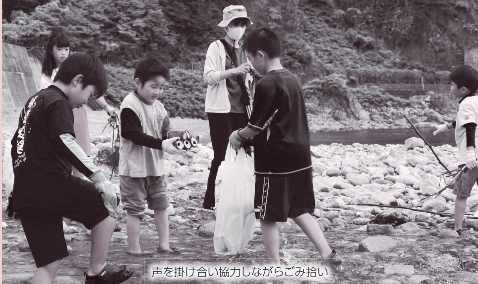
声を掛け合い協力しながらごみ拾い