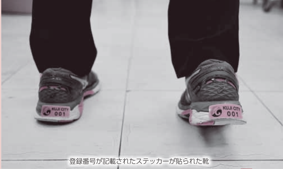
登録番号が記載されたステッカーが貼られた靴